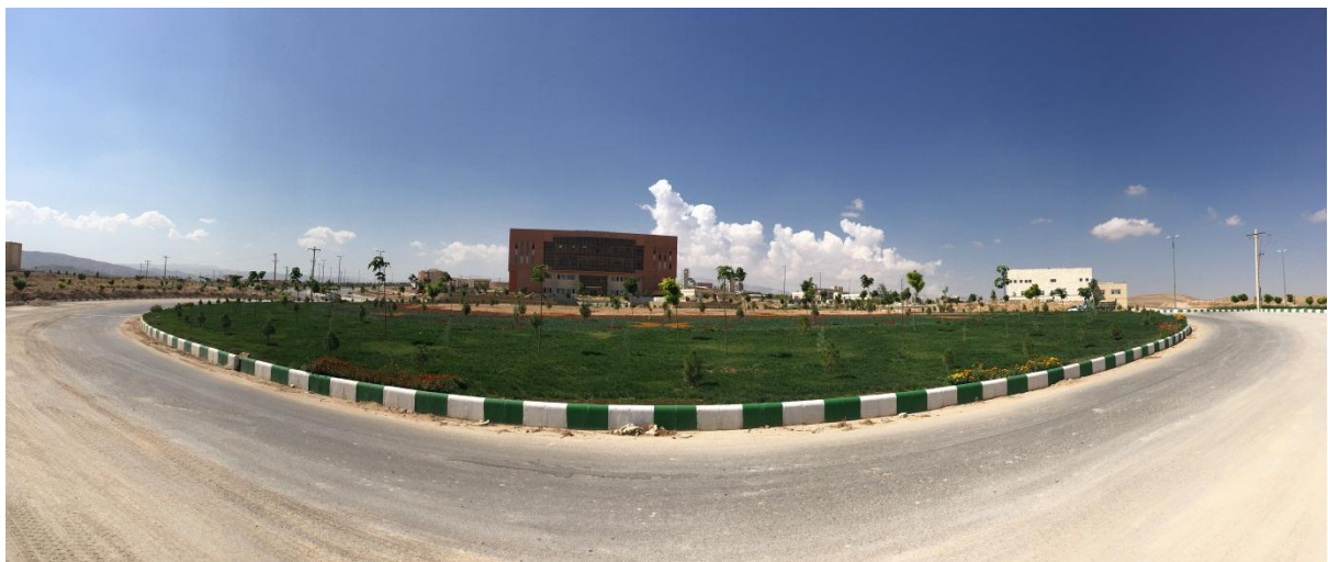
تصویر پانوراما از حاشیه میدان به سمت سازمان مرکزی

سازمان مرکزی دانشگاه بجنورد طرحی یو شکل دارد که در فاز اول قسمت میانی این طرح اجرا گردیده و در تابستان ۹۶ تحویل موقت گردیده و به بهره برداری رسیده است. ساختمان فوق که فضاهای مدیریتی دانشگاه را در بر میگیرد در چهار طبقه و به ارتفاع ۱۹ متر و به ابعاد ۱۷,۷۵ در ۴۸,۶۵ به شکل مستطیلی کشیده بر فراز ضلع شرقی میدان صلح و با قریب به ۳,۲۴ متر ارتفاع از سطح سواره رو حاشیه میدان، به صورت مسلط به آن قرار گرفته است. مترپال اصلی در ساخت این بنا شیشه به صورت نمای کرتین وال و آجر سفال سوراخدار قرمز و سنگ تراورتن سوپر حاجی آباد می باشد.