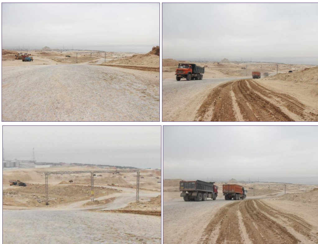
تصویر ۶: موقعیت ورودی اصلی در پلات پلان